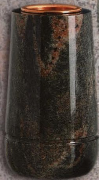
vaso a terreno Margherita

Giglio Vaso: H20xØ25, foro Ø10 pass. H20xØ30, foro Ø10 pass. H20xØ35, foro Ø11 pass. H20xØ40, foro Ø12 pass. Lume: H9xØ15, foro Ø4