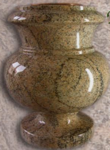
vaso a terreno Iris Pallida