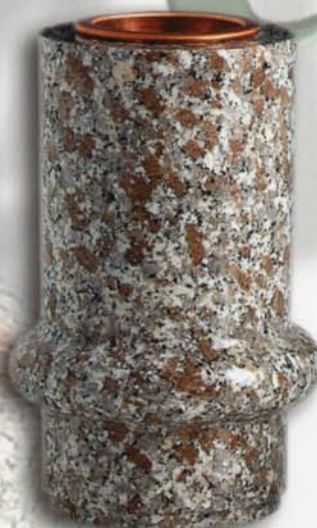
vaso a terreno Orchidea