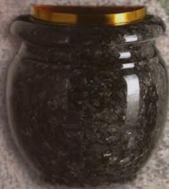
mezze tazze a parete Ibiride 2

Tazza: H20xL20xP10, foro H16xL12xP6 1/2 Lume: H10xL16xP8, foro Ø4