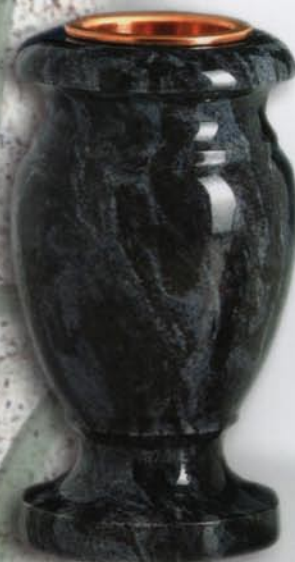
vaso a terreno Papavero