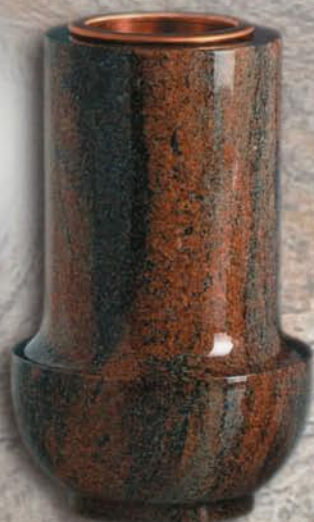
vaso a terreno Ciclamino