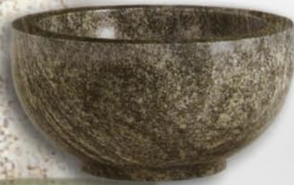
ciotola con interno tornito Primula