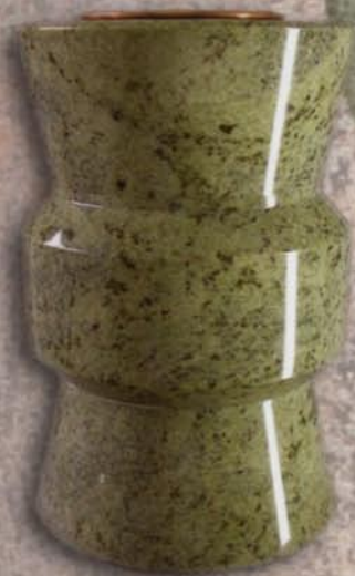
vaso a terreno Gladiolo

Robinia Ispida Vaso: H18xØ25, foro Ø15 pass. Lume: H10xØ13, foro Ø4