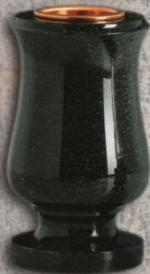
vaso a terreno Tulipano

Vaso: H30xØ20, foro H24xØ10 Lume: H13xØ13, foro Ø4