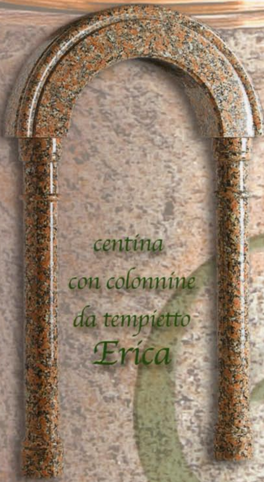
centina con colonnine da tempietto Erica