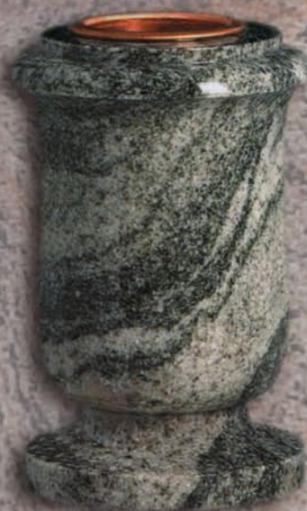
vaso a terreno Vinca