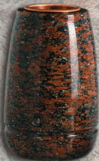
vaso a terreno Rosa