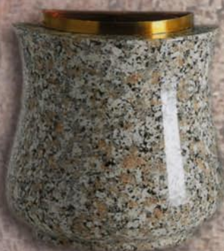
mezze tazze a parete Girasole 1

Verbena 2 Tazza: H20xL20xP10, foro H16xL12xP6 Lume intero: H10xØ10, foro Ø4