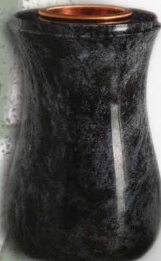
vaso a terreno Gelsomino